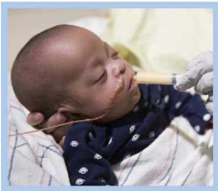
Me nyuam haus tau kua mis ntshiab ntawm tus raj tshuaj