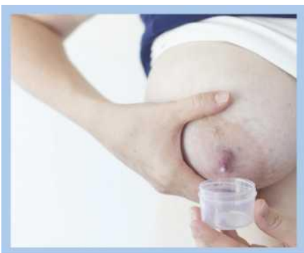
Leej niam xuas tes nyem kua mis